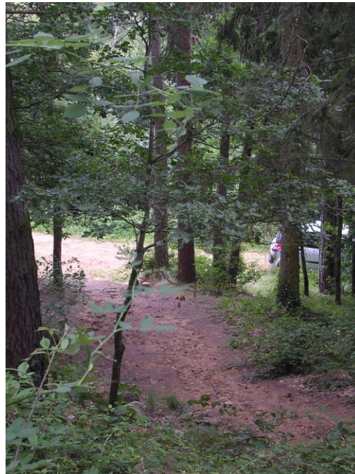
* De la station, sentier à gauche et Mont Redon à droite