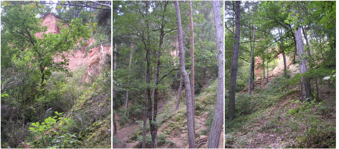
* L'environnement de la cheminée des fées : la forêt et les falaises d'argile