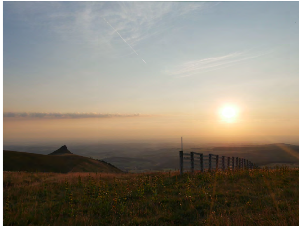
Le pic à gauche se nomme le Roc de Courlande