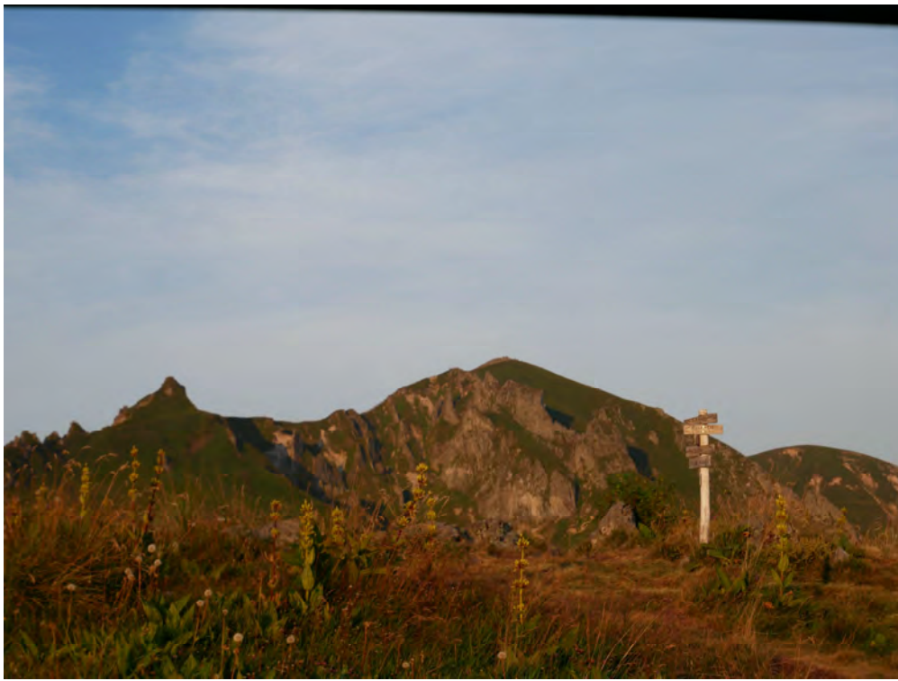
Point de vue sur le Sancy marquant l'entrée dans la réserve