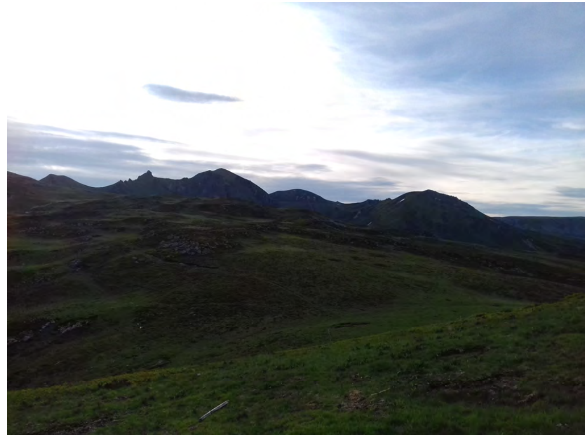
Le site vu depuis le pied du Roc de Courlande