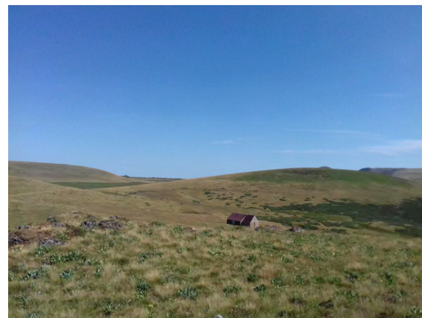
Le buron de la Montille vu du sommet