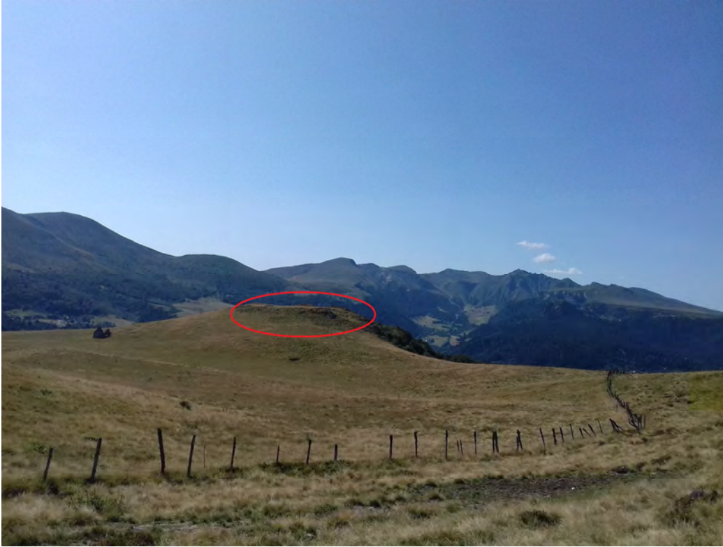
Pic sans nom et burons vus depuis le GR30