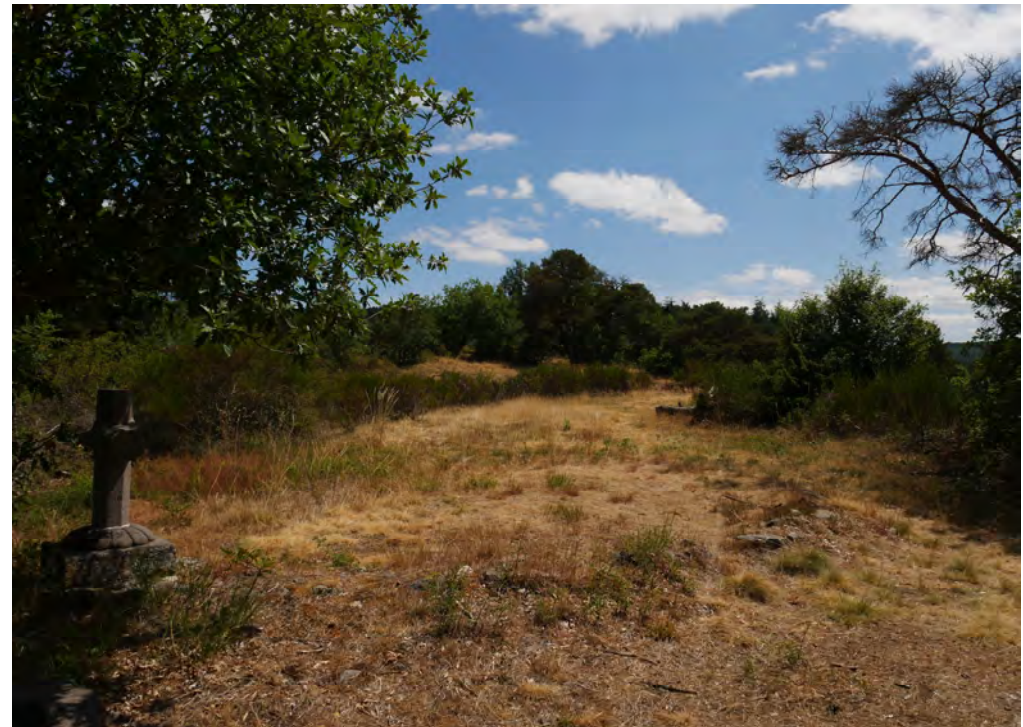
Le sol est assez rocailleux par endroits