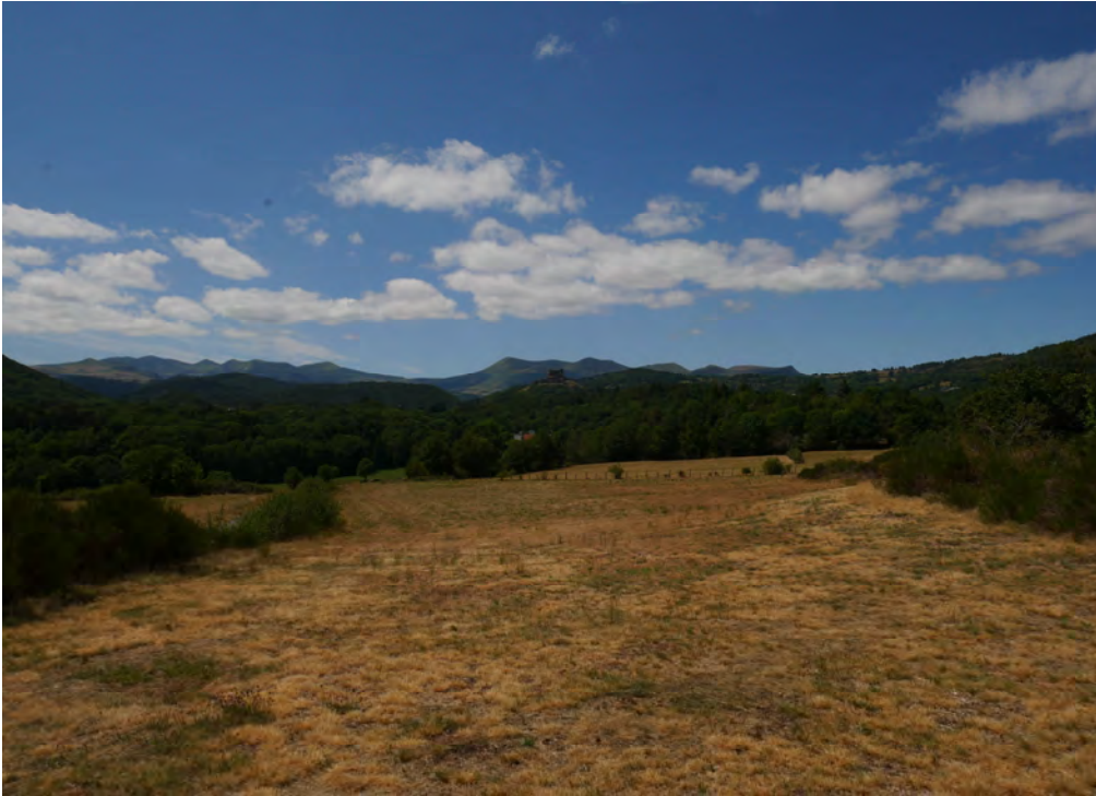
La vue sur le château de Murol et les pentes est du Massif