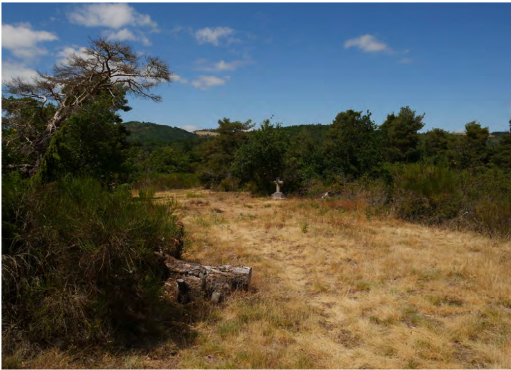
Vue sur la Croix depuis la piste