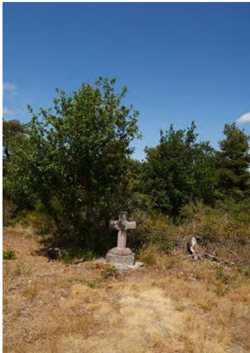
La croix et son socle